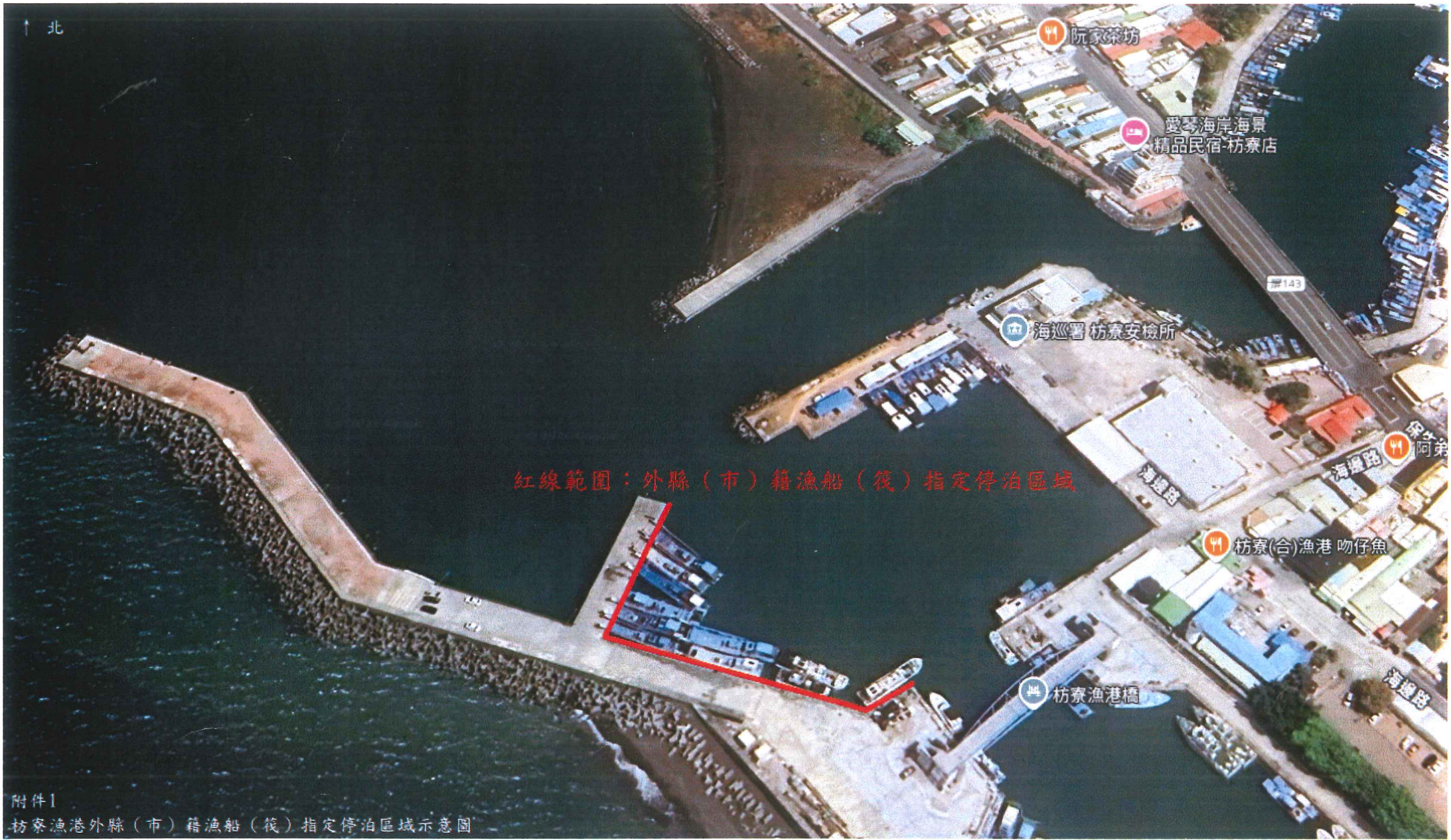
附件1 枋寮漁港外縣(市)籍漁船(筏)指定停泊區域示意圖